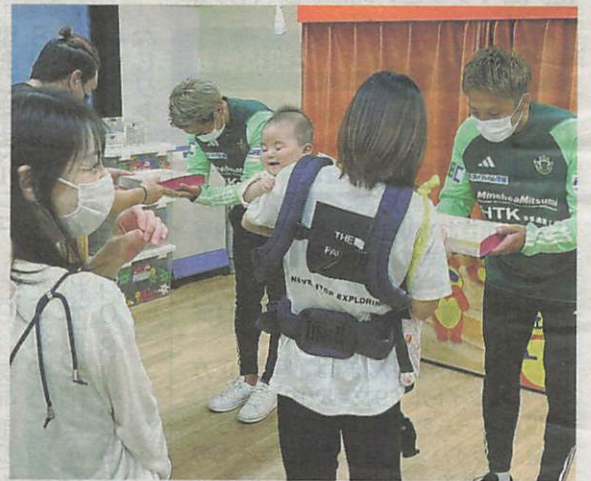
「喫茶山雅」で作った弁当を親に手渡す選手たち

第1回の6月26日 一人一人の話しに真摯に向き合い、励ますと、徐々に和んだ雰囲気になった。保護者は充実した様子で問題があったりする。食事以外でも自由な時間が少ないためストレスがたまってしまう。そこで手を挙げたの